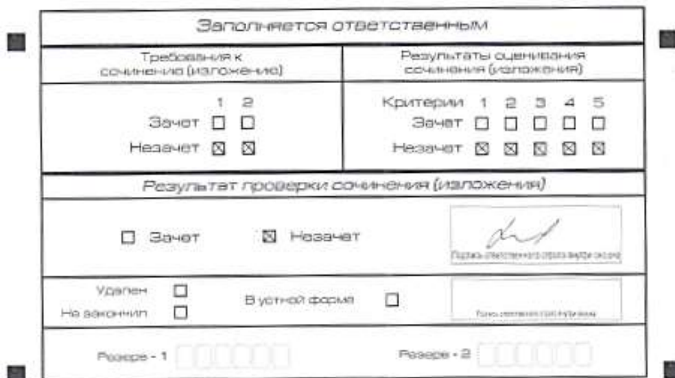
Рис. 1. Область для оценки работы

Если итоговое сочинение (изложение) соответствует требованиям № 1 и № 2, то эксперт комиссии по проверке выставляет «зачет» за выполнение требований № 1 и № 2. Указанные сочинения (изложения) оцениваются по критериям.