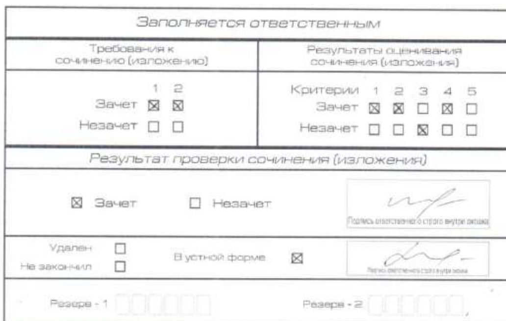
Рис. 9. Область для оценки работы сочинения (изложения) в устной форме

После окончания заполнения бланка регистрации ответственное лицо ставит свою подпись в специально отведенном для этого поле.